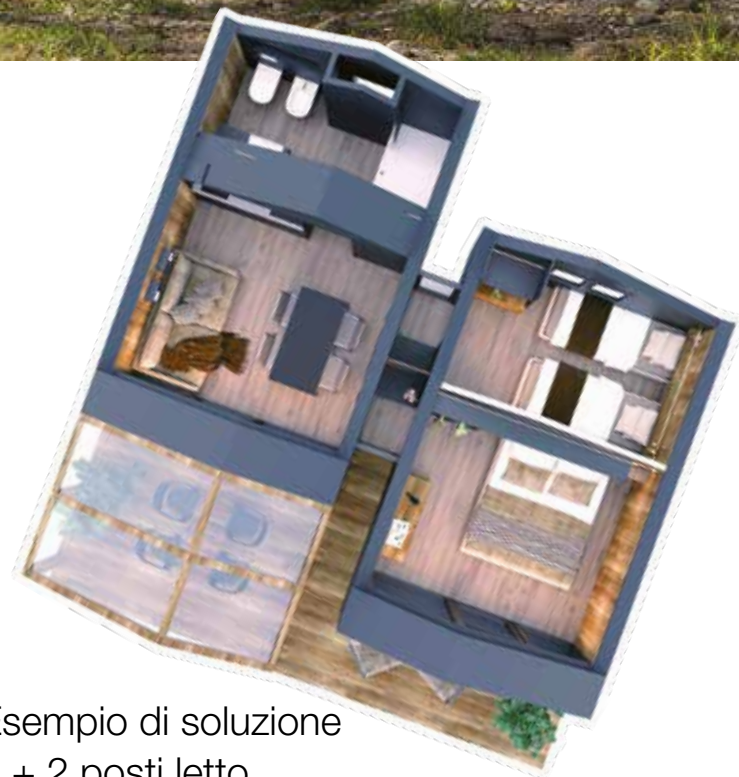
Esempio di soluzione 4 + 2 posti letto